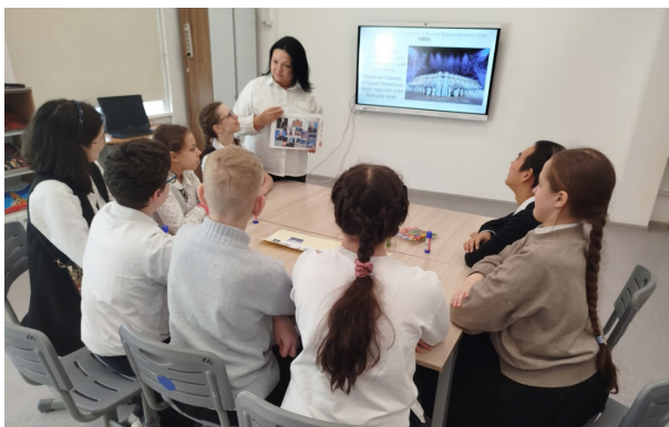
Этноатлас «Край родной, навек любимый»